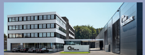
SMW-AUTOBLOK Hauptgebäude Meckenbeuren