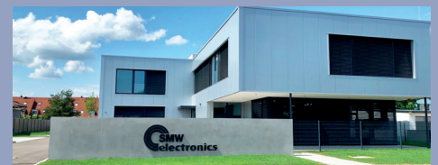
SMW-electronics Gebäude Meckenbeuren