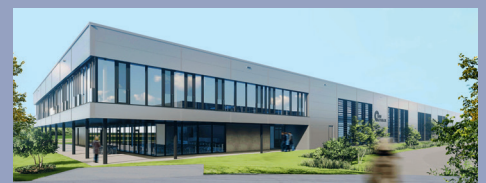
AIRPORT FACTORY Anfang 2026 Meckenbeuren

Damit du uns vorab schon kennenlernen kannst, besuche unsere Homepage: