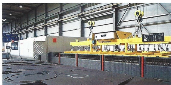
◀ Tecnomagnete permanent elektromagnetsystem.